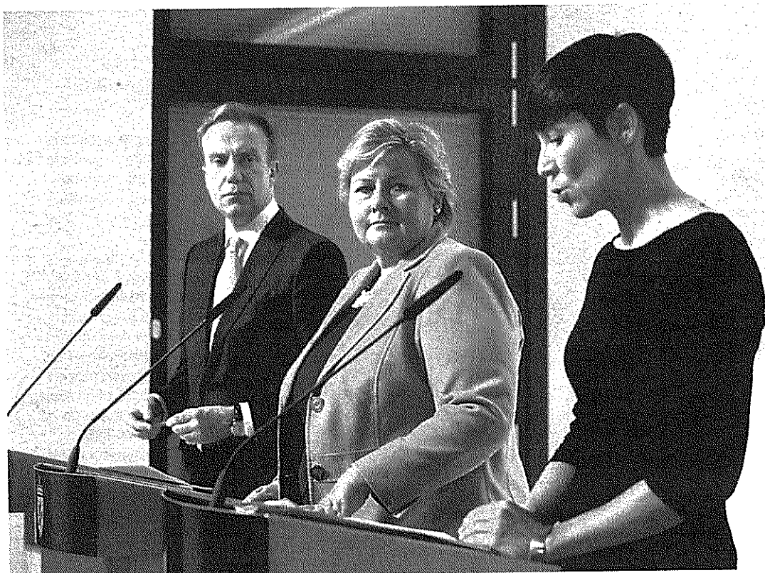
KAMPKLAR: Regjeringen opplyser at det norske styrkebidraget vil bestå av personell fra Hæren og Spesialstyrkene. – Det trengs en bred allianse i kampen mot IS. Både arabiske og vestlige land har respondert positivt på Iraks forespørsel. Det gjør også Norge, uttalte statsminister Erna Solberg på pressekonferansen med utenriksminister Børge Brende og forsvarsminister Ine Eriksen Søreide.